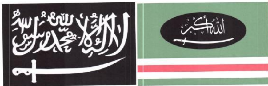
Рисунок 14. Символика вилайятов (административно-территориальных образований) организации «Кавказский эмират» («Имарат Кавказ»).

Отсутствие осознания общественной опасности террористических проявлений подростком может выражаться в наличии в публикациях на его странице или странице его друзей, а также страницах сообществ (групп), в которых он состоит (на которые подписан), информационных материалов, оправдывающих совершение преступлений экстремистской и террористической направленности, в том числе на территории зданий органов государственной власти и местного самоуправления.