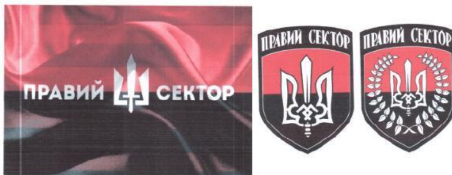
Рисунок 11. Атрибутика организации «Правый сектор».