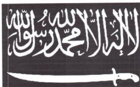
Рисунок 13. Символика организации «Кавказский эмират» («Имарат Кавказ»).