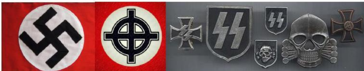
Рисунок 10. Нацистская атрибутика и символика.

Атрибутики, символики запрещенных в Российской Федерации экстремистских и террористических организаций: