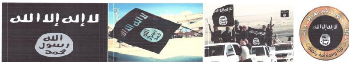
Рисунок 12. Символика организации «Исламское государство».